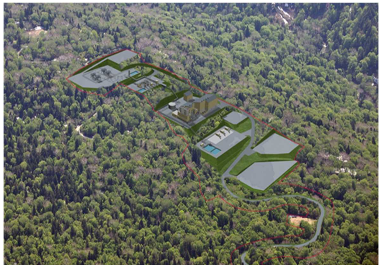
発電所完成予想図